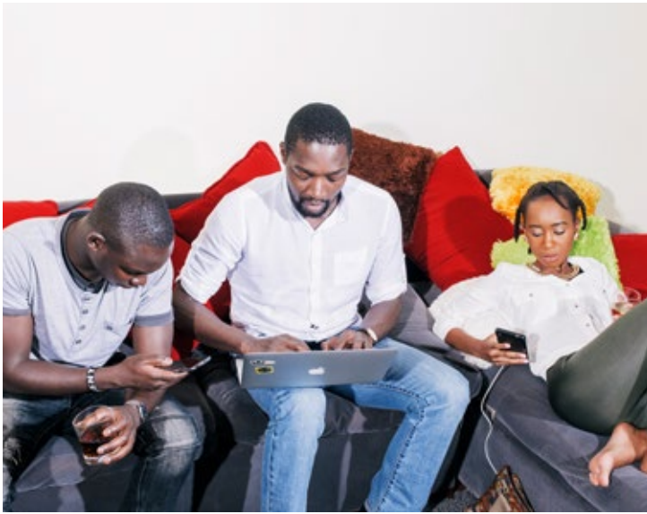
Fast 18 Millionen Menschen (von circa 49 Millionen) verfügen in Kenia bereits über einen Breitbandanschluss