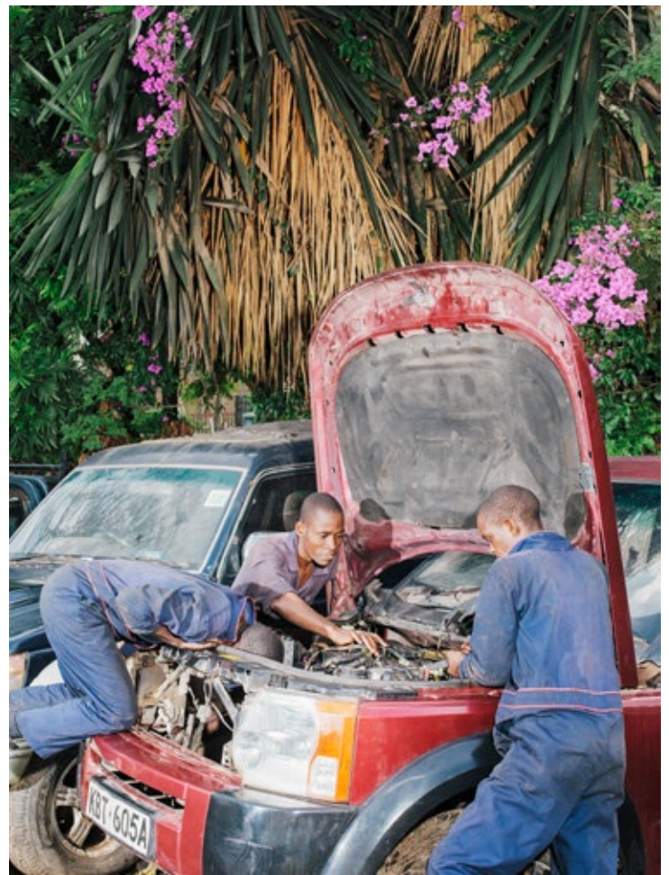
Tüftler und Schrauber: Das Start-up AB3D bastelt aus Elektroschrott 3-D-Drucker. An Autos schrauben die Mitarbeiter aber auch gern rum