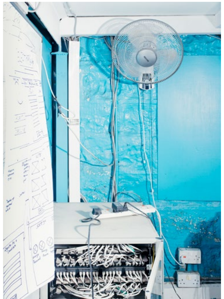
Um die Demokratie im Land zu stärken, haben junge Softwareentwickler eine Wahl-App erdacht