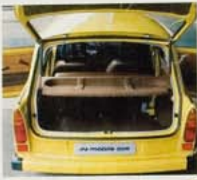
Die normale Kofferraumvariante des Universal-S- und -S- de Luxe mit Fondablage