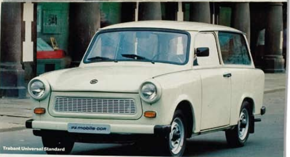
Trabant Universal Standard