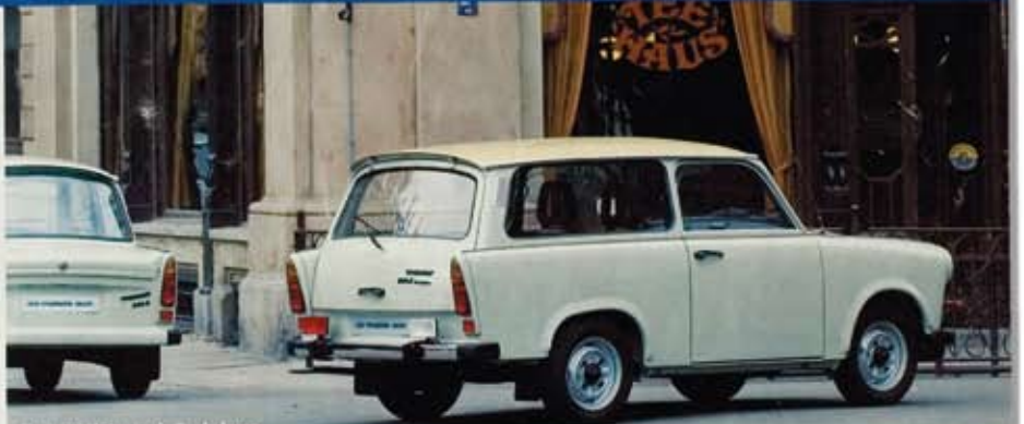
Trabant Universal-S- de Luxe