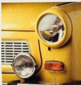
Nebelscheinwerfer der -S- de Luxe-Ausführung