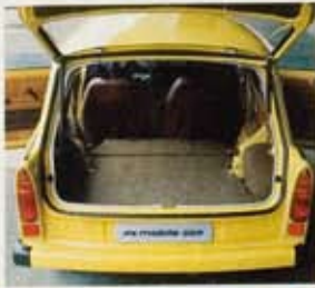
Volle Laderaumnutzungsmöglichkeit bei umgeklappter Rückbank