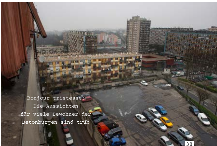
Bonjour tristesse: Die Aussichten für viele Bewohner der Betonburgen sind trüb