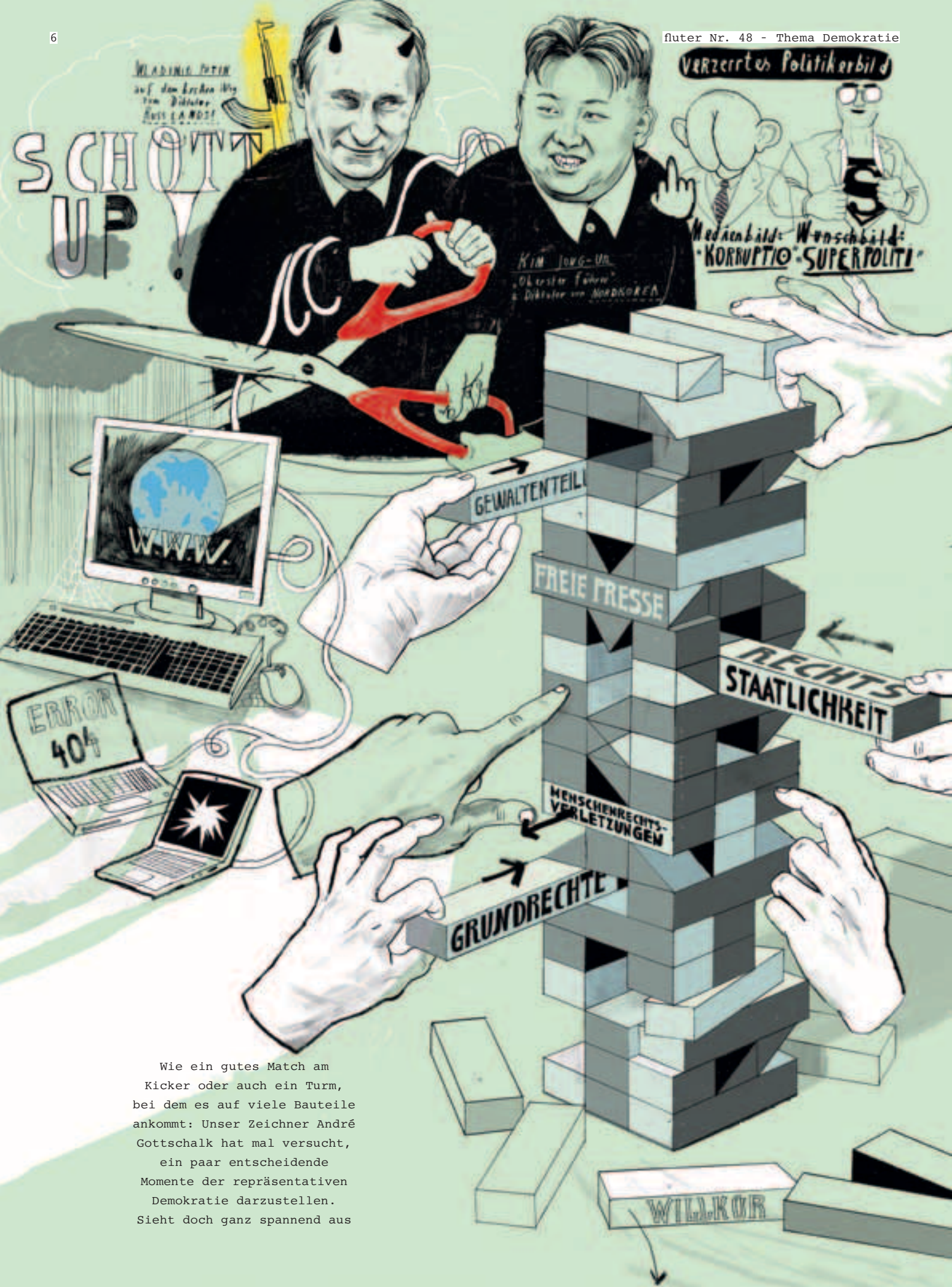
Wie ein gutes Match am Kicker oder auch ein Turm, bei dem es auf viele Bauteile ankommt: Unser Zeichner André Gottschalk hat mal versucht, ein paar entscheidende Momente der repräsentativen Demokratie darzustellen. Sieht doch ganz spannend aus