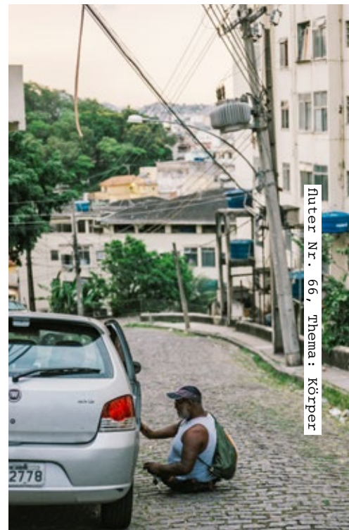
Inter Nr. 66, Thema: Körper

Er reht sich ein in die Straßenverkäufer-Promenade, nimmt seinen Platz gleich neben dem U-Bahn-Lüftungsschacht ein, rechts von ihm die Handyhüllen-Frau, die auch gebrannte CDs für 9,99 Reais und grellfarbene Kinderröcke verkauft.