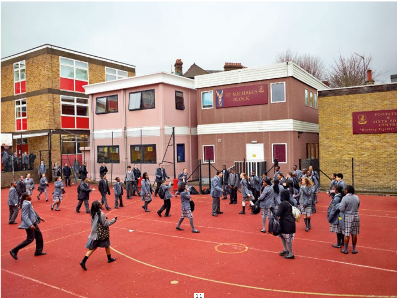
Katholische Schule Sacred Heart, London, England