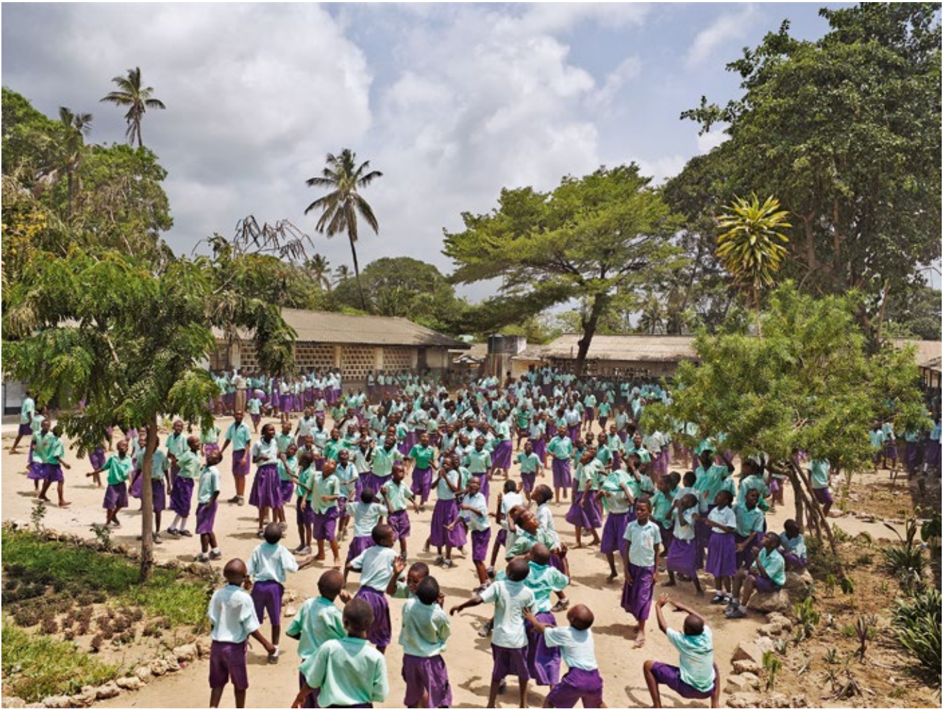
Freretown-Community-Grundschule, Mombasa, Kenia