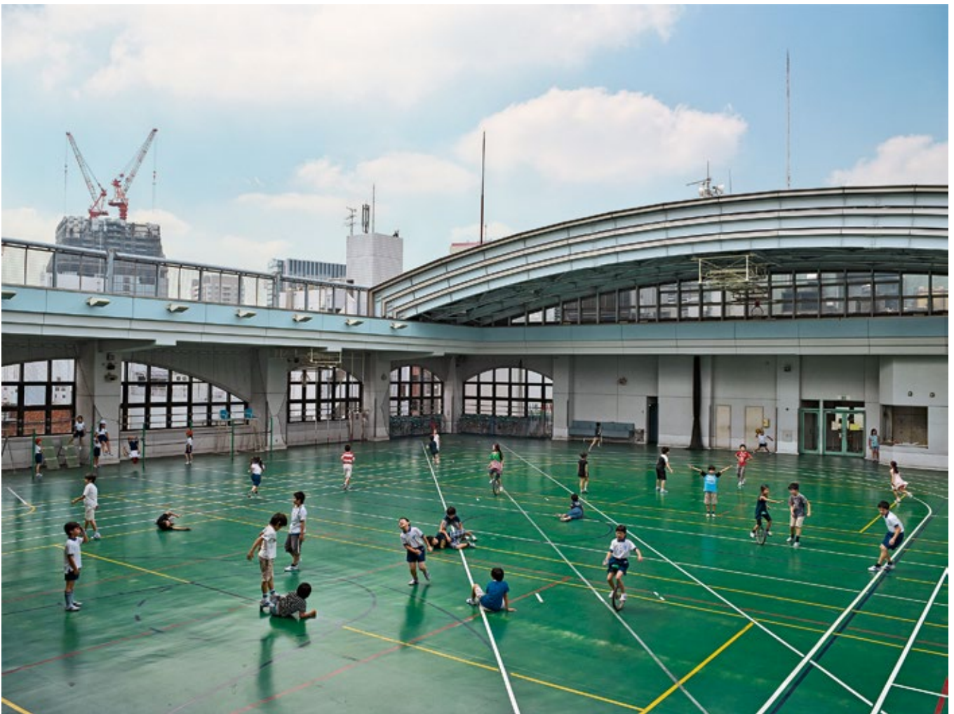
Shohei-Grundschule, Tokio, Japan

Links: Katholische Schule St. Augustine, Palm Loop, Montserrat