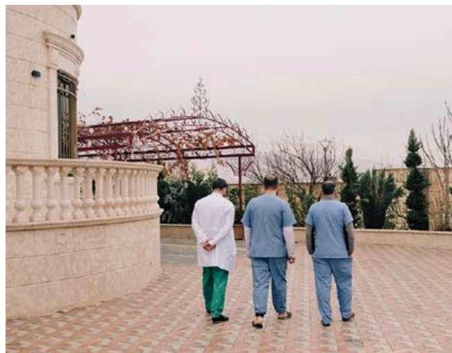
Das „Hope Center“ ist die erste Entzugsklinik des Landes