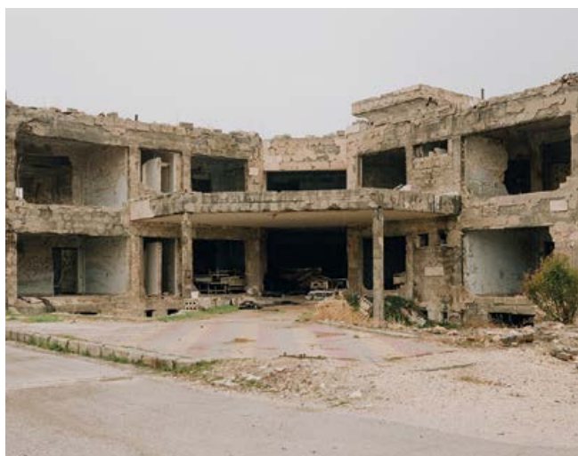
Auch im Ibn-Khaldoun werden Suchtkranke behandelt. Dem Krankenhaus sieht man den Krieg deutlich an

Wer den Weg ins Zentrum schafft, hat genau drei Wochen für den Entzug. Das Team überwacht körperliche Reaktionen, bietet Gruppensitzungen, Gespräche, Filme. Die Patientinnen und Patienten sollen ihren Körper und