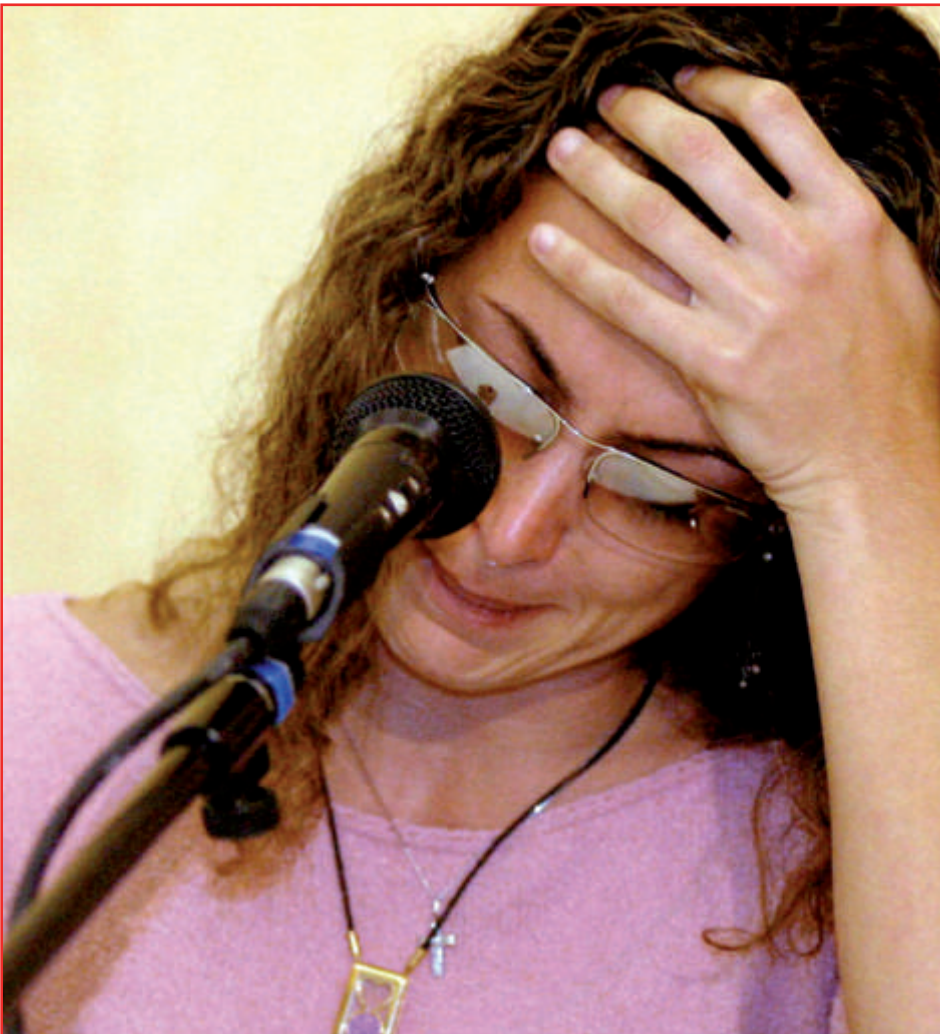
1. August 2003: Die brasilianische Leichtathletin Maurren Maggi wird vom Internationalen Leichtathletik-Verband wegen eines positiven Tests auf anabole Steroide für zwei Jahre gesperrt.

Online-Bestelladresse: www.fluter.de/abo