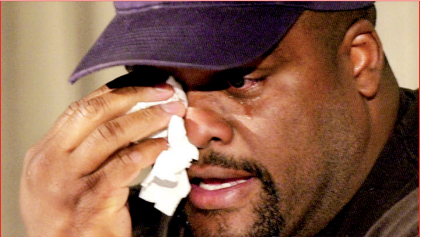
26. September 2000: C.J. Hunter (USA), Kugelstoß-Weltmeister und Ehemann von Marion Jones, gesteht die Einnahme von Nandrolon, beteuert aber, er habe das anabole Steroid nicht vorsätzlich eingenommen. Seine Karriere ist nach der Pressekonferenz jedoch beendet.

S port und Religion, heißt es oft, haben viel gemeinsam. Meist geht es im Sport um Vergötterung der Helden, die in Stadien, in Schwimmhallen und auf Landstraßen zeigen, wie man schafft, was man sich erträumt. Viel seltener geht es um Sünden, die fast immer von Doping handeln. Dabei sind die Dramen, die auf die Sünden folgen, manchmal fesselnder als Wettkämpfe: Marion Jones, die Sprintkönigin der Olympischen Spiele von Sydney, weinte, als sie wegen Meineids ins Gefängnis musste. Erik Zabel weinte auch, obwohl er angeblich bloß zwei Wochen dopte und gleich nach seiner Beichte weiterradelte. Jörg Jaksche sündigte, fand zum rebellischsten Akt, zur Wahrheit über den Radsport, und kämpfte dann vergeblich um