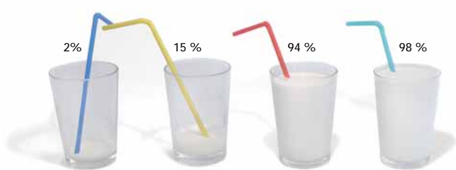
Anteil der Bevölkerung mit Laktoseintoleranz (Milchzuckerunverträglichkeit) (8)

82 % aller Deutschen geben an, innerhalb der letzten 24 Monate eine Diät zur Gewichts- abnahme gemacht zu haben (3)