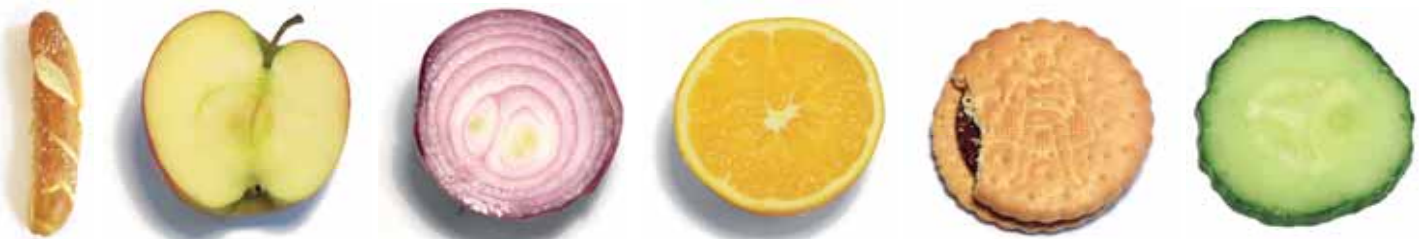
Durchschnittliche Zahl der Mahlzeiten, die ein 50-jähriger Deutscher in seinem Leben gegessen hat (3)