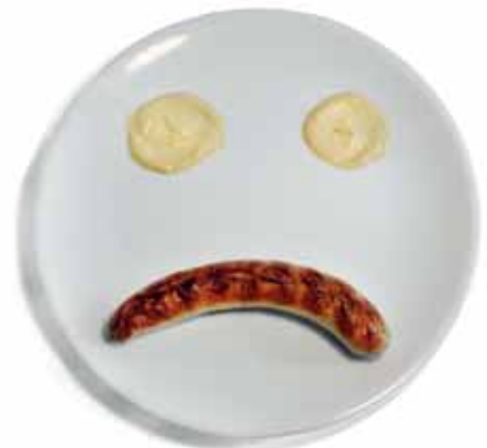
85 % sind unzufrieden mit ihren Ernährungsgewohnheiten (9)